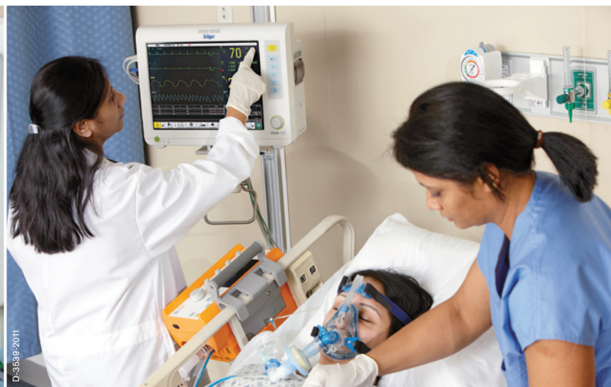
Отделение неотложной помощи: монитор Vista 120 и аппарат искусственной вентиляции легких Oxylog® 2000 plus