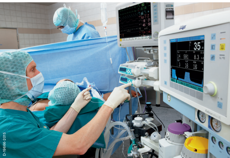
Операционная: монитор Vista 120, наркозный аппарат Fabius® plus XL и газовый анализатор Scio® Four