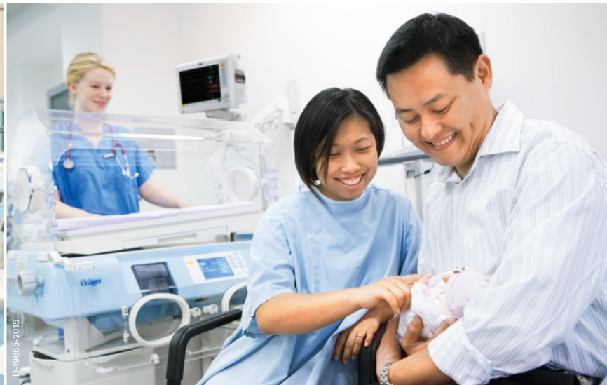
Отделение реанимации новорожденных: монитор Vista 120 и инкубатор Isolette® 8000