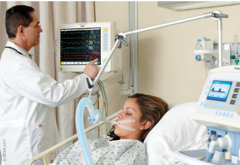
Отделение реанимации: монитор Vista 120 и аппарат искусственной вентиляции легких семейства Savina®